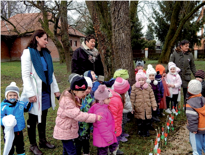
Nemzeti ünnep: óvodások a kopjafánál