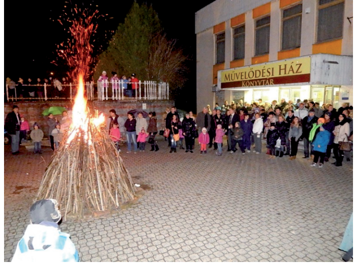
Ördögűzés máglyagyújtással a közösségi téren