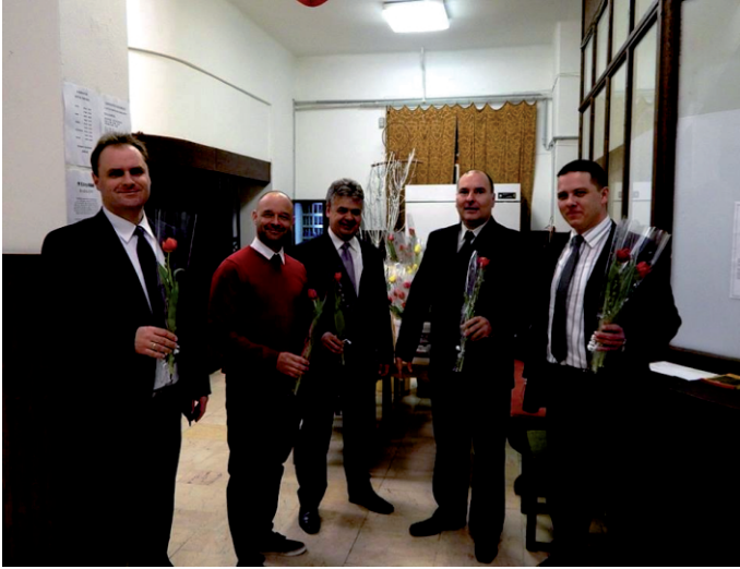
Nőnapi „fogadóbizottság” a művelődési házban