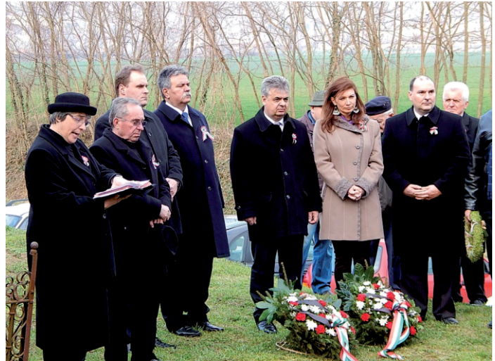
Nemzeti ünnep: koszorúzás a terehegyi temetőben