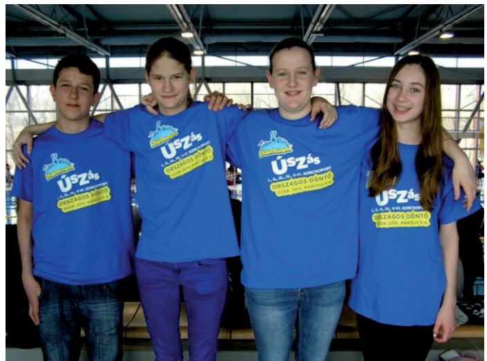
Diákolimpia, úszás: országos döntőbe jutottak

Tavaszi lomtalanítás: április 23. Zöldhulladék gyűjtés: április 14, 28