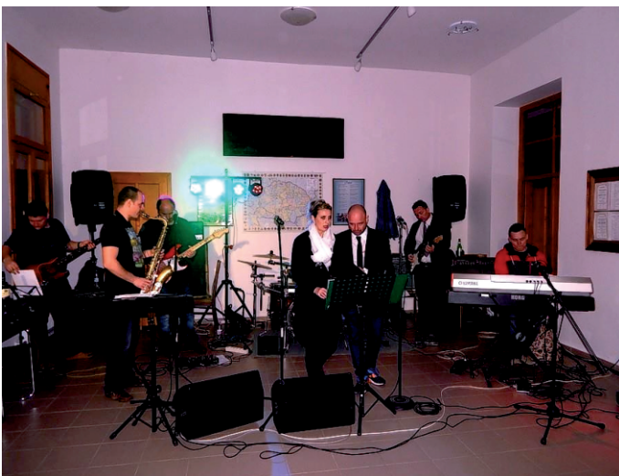
Tavaszköszöntő ünnep: Csak Apa Kedvéért koncert