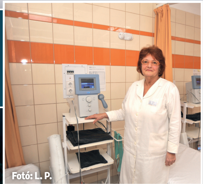
Fotó: L. P.

Közülük is kiemelném a homeopátiát és az akupunktúrát, mert nem csak hiszek bennük, de sokáig gyakoroltam is a használatukat. Az akupunktúra például mozgásszervi problémáknál hihetetlenül gyors javulást eredményez, lézerrel kombinálva pedig akut gyulladásokban is látványos gyógyulást hoz. De ez csak a testről szól, a lélek rendbetételét, a globális gyógyulást a homeopátiával látom elérhetőnek. Egyetlen szert adunk személyre szabva, ami pszichiátriai gondokra is jó hatással van. Másrészt ta-