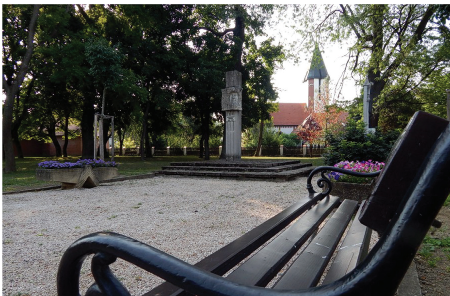
Jelentősen megszépült a katolikus templom szomszédságában található Zsigmond-szobor környezete, ahova a virágtartókat és padokat helyeztek el.