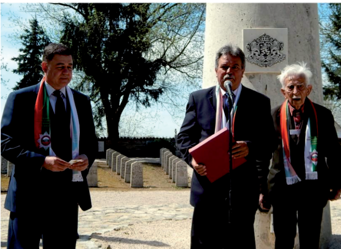
Ünnepi megemlékezés a bolgár katonai temetőben