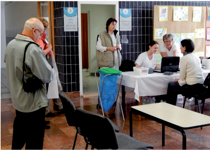
Véradás a Gyógyfürdő Zrt. márványcarnokában