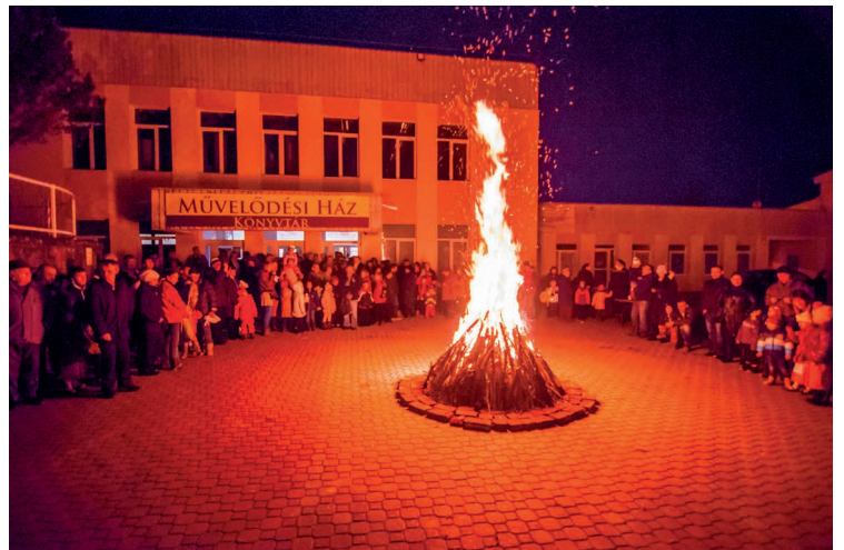
Tizenhatodik alkalommal gyúltak fel a lángok a művelődési ház előtti téren. Az estét az óvodások és az iskolások nyitották, majd a horvát és a német nemzetiségi énekkar adott műsort. A lángok fellebbanása után a Harka Dalkör énekelt.