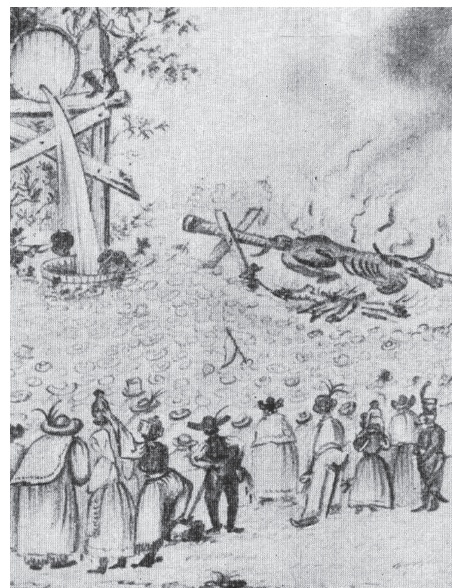
Népünnepély Harkányban (1845)