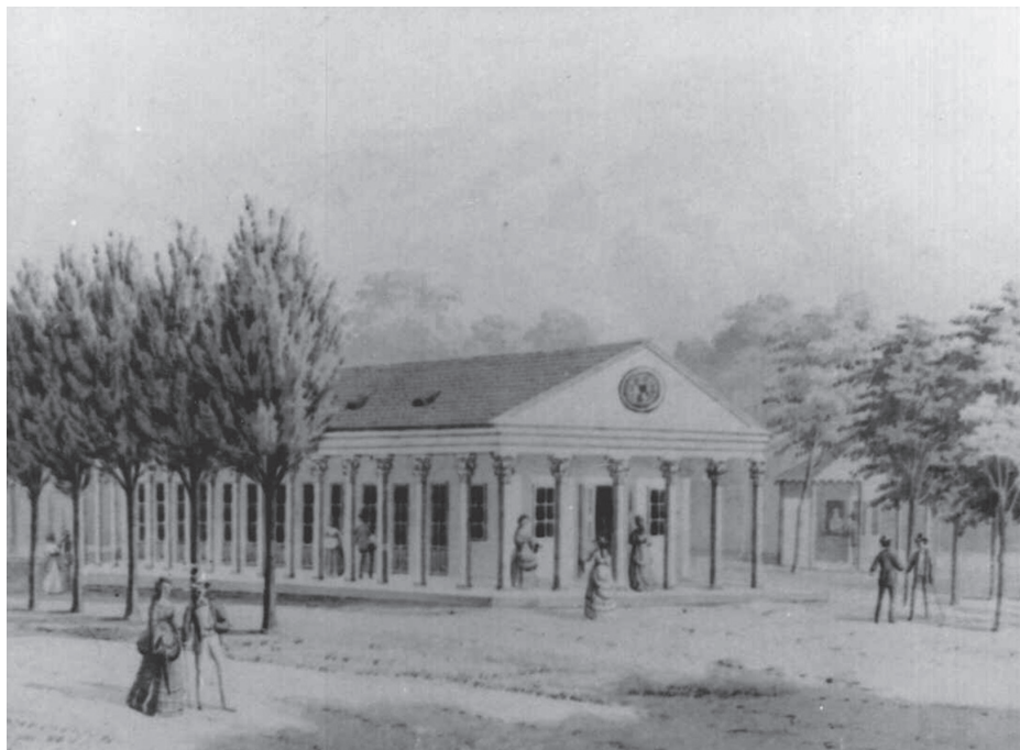
I. osztályú fürdőház (Kossuth-fürdő) 1845-ben